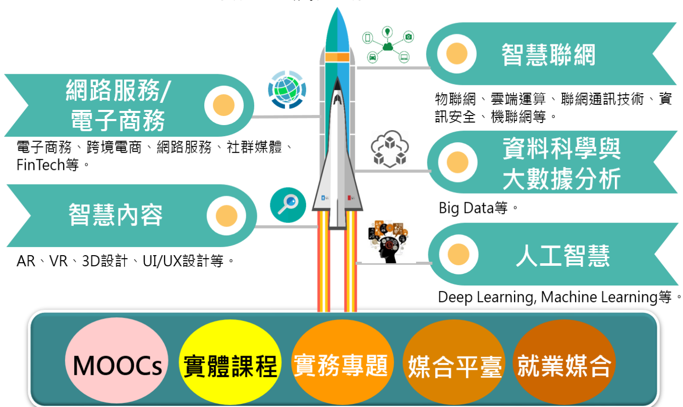
圖 1 本計畫定位